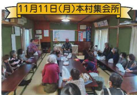
11月11日(月)本村集会所