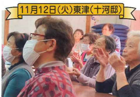
11月12日(火)東津(十河邸)