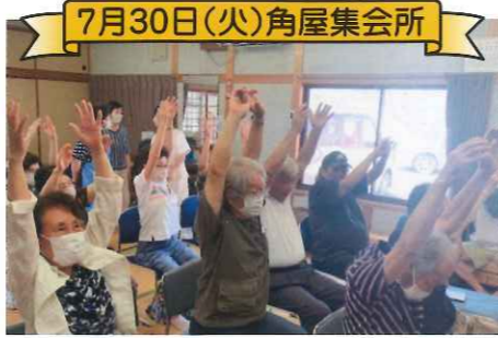
7月30日(火)角屋集会所