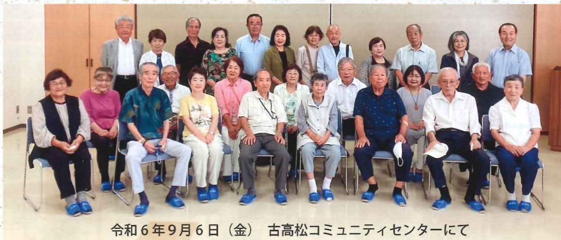
令和6年9月6日(金) 古高松コミュニティセンターにて

令和6年に結婚50周年を迎えた20組のご夫婦に古高松福寿会より記念品が贈られました。