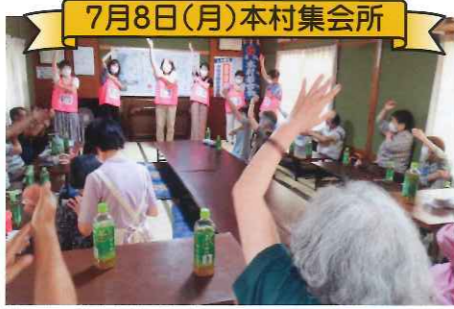
7月8日(月)本村集会所