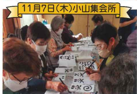
11月7日(木)小山集会所