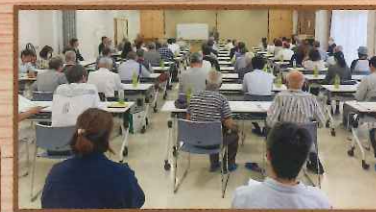
総会 令和6年6月9日(日)