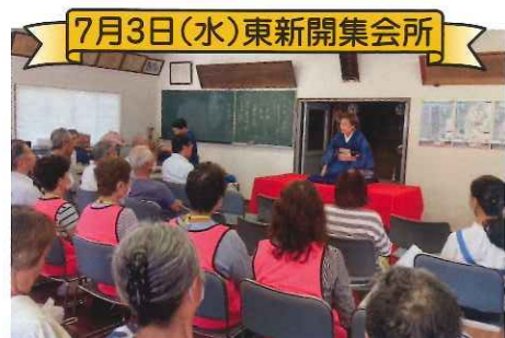
7月3日(水)東新開集会所